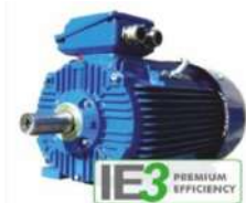
มอเตอร์ประสิทธิภาพสูง

กปภ. ได้มีการนำมอเตอร์ประสิทธิภาพสูงมาใช้งานร่วมกับเครื่องสูบน้ำในสถานีผลิต-จ่ายน้ำของ กปภ. ที่มีการเดินเครื่องเป็นเวลานาน ทำให้เห็นผลการประหยัดพลังงานไฟฟ้าได้ชัดเจน และจะประหยัดพลังงานมากขึ้นเมื่อใช้งานร่วมกับ VSD