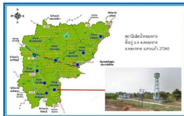
รูปแสดงที่ตั้งสถานีผลิตน้ำคลองหาด