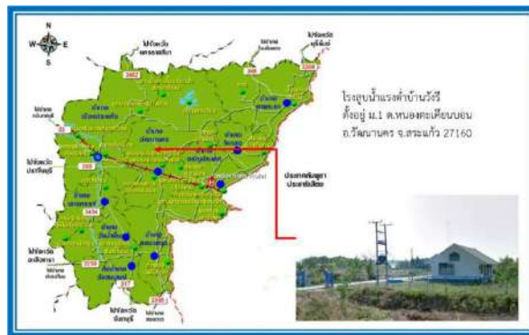
รูปแสดงที่ตั้งโรงสูบน้ำแรงต่ำบ้านวังรี