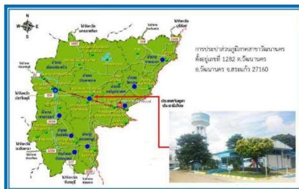
รูปแสดงที่ตั้งสำนักงานการประปาส่วนภูมิภาคสาขาวัฒนานคร